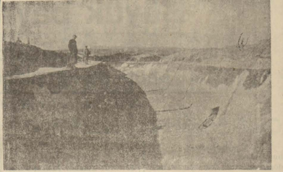
Tarsusta sulama ameliyatından bir görünüş

Tarsus belediye meclisi Bugün toplanacak