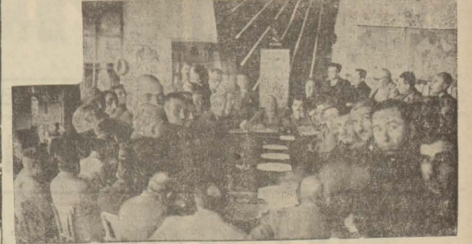
Tarsusta büyük ziraatı kongresine hazırlanacak rapor müzakere edilirken

Kongre kuvvetli bir ihtimalle göre ikinciteğrinin on beşinci toplantı olacaktır.